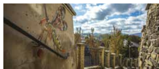
Niezwykłe owady w Gorlicach - s.8-9