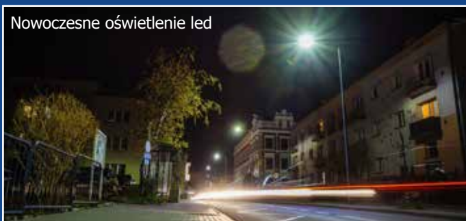
Nowoczesne oświetlenie led