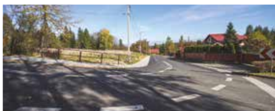
Ulica Łokietka po remoncie - s.7