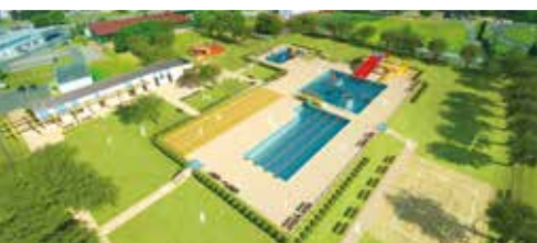
15 milionów zł na remont basenu odkrytego - s.5