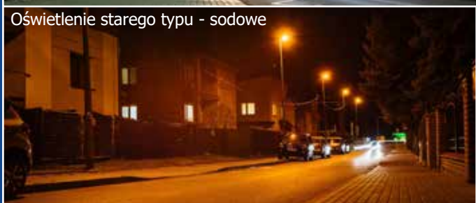
Oświetlenie starego typu - sodowe

Długo wyczekiwanego remontu doczeka się otwarty basen kąpielowy, a dzięki modernizacji oświetlenia poprawi się także bezpieczeństwo gorliczan! Miasto Gorlice otrzymało łącznie 14 899 950 zł dofinansowania na realizację tych ważnych działań w ramach Programu Inwestycji Strategicznych „Polski Ład”!